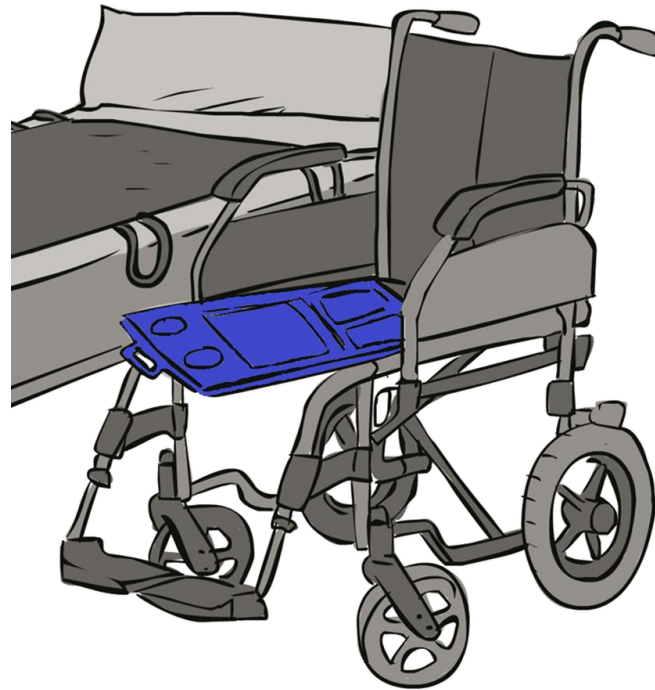
Tabla de transferencia