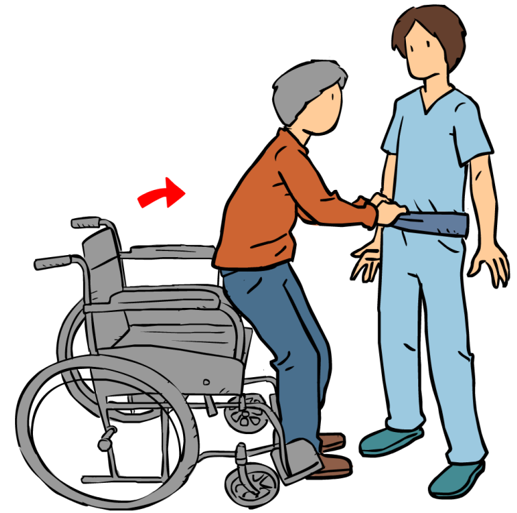
Cinturón de sujeción