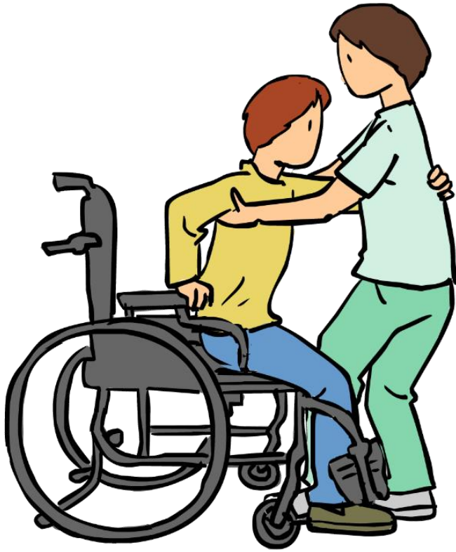
Silla de ruedas